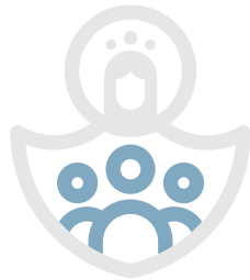
Anak-anak/Lansia/ Dewasa Rentan/ Difabel