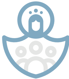
Bunda Maria/ Gereja